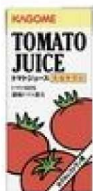
14-186 無塩トマトジュース