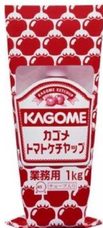
14-3 トマトケチャップ標準チューブ