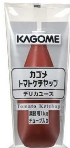
14-4 トマトケチャップデリカユース

業務用トマトケチャップとして最もポピュラーです。 酸味、甘味、うまみのバランスがよく、幅広い 用途でご利用頂けるJAS標準グレード品です。