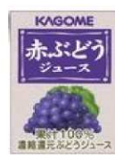
14-134 赤ぶどうジュース