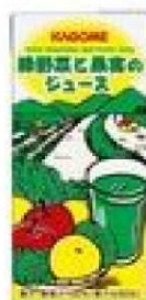
14-189 緑野菜と果実のジュース