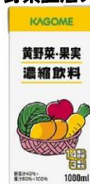
14-324 黄野菜・果実濃縮飲料